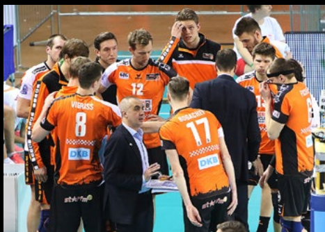
01. März 2017: 0:3 bei Cucine Lube Civitanova