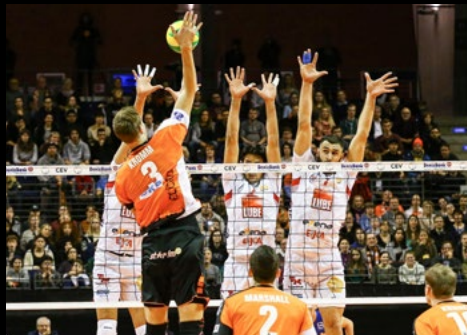
06. Dez 2016: 3:1 gegen Cucine Lube Civitanova