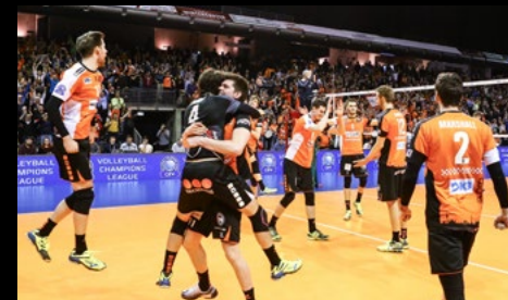
21. März 2017: 3:2 + Golden Set vs. Istanbul BBSK