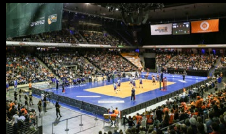
05. April 2017: 3:2 gegen Dynamo Moskau