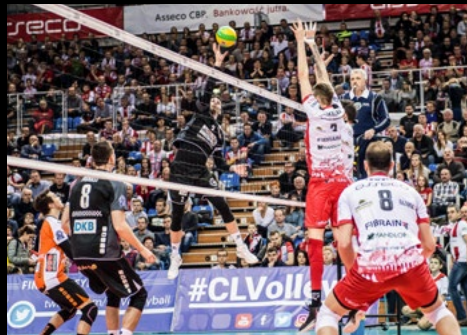
22. Dez 2016: 2:3 bei Asseco Resovia Rzeszow