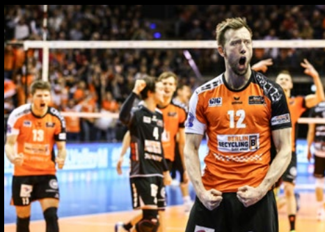
14. Feb 2017: 3:2 gegen Asseco Resovia Rzeszow