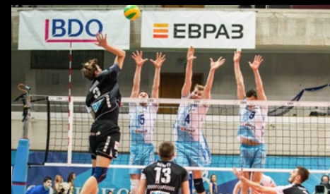
12. April 2017: 3:2 bei Dynamo Moskau