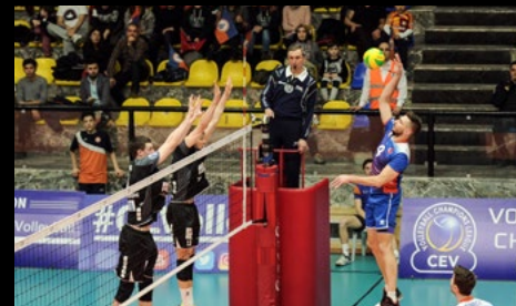
15. März 2017: 2:3 bei Istanbul BBSK