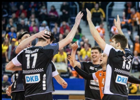
18. Jan 2017: 3:0 bei Dukla Liberec