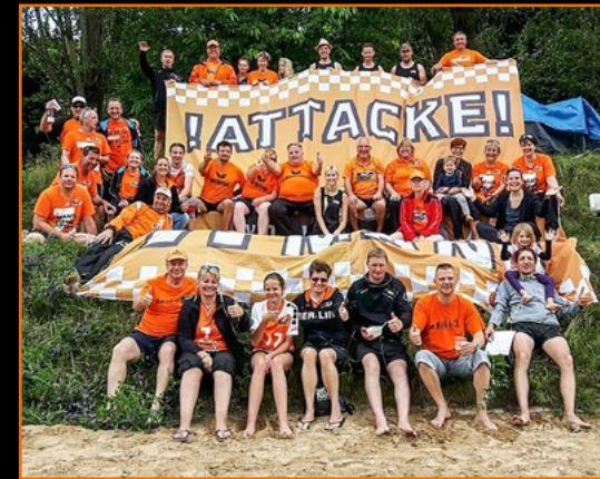
Der 7. Mann bei den Fanclubmeisterschaften 2016, bei denen die Plätze 1 bis 3 erobert wurden.

Für das leibliche Wohl auf dem tollen Sportgelände ist gesorgt. Wir warten auf Euch!