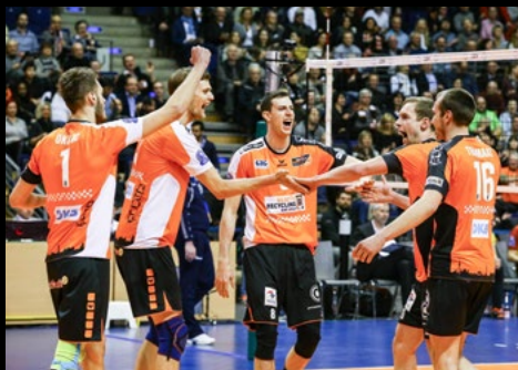
02. Feb 2017: 3:0 gegen Dukla Liberec