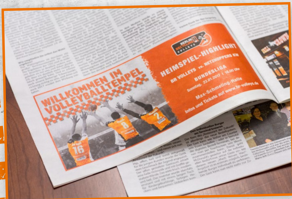
Präsent in der Reinickendorfer Allgemeinen Zeitung: Viele Heimspiel-Highlights der Bundesliga und der Champions League werden in der RAZ groß angekündigt.