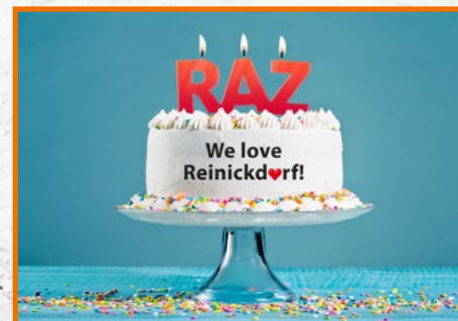
Im Februar feierte die RAZ ihr Jubiläum.

Das große Spektrum 14-täglich in interessanten Artikeln und Reportagen abzubilden und damit einen Dialog zwischen den Reinickendorfern zu