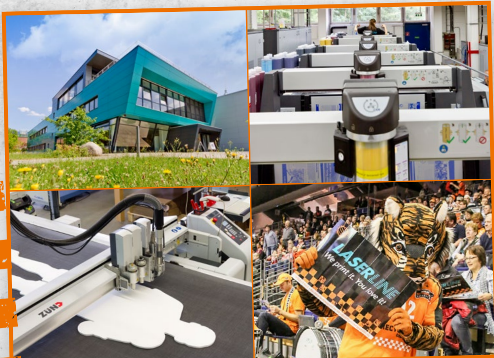
Druckvielfalt aus dem Hause LASERLINE.