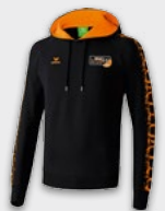
ERIMA Hoody 39,95 €