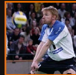
Der Libero führte den SCC mit seinen Annahmen zu zwei Meistertiteln.