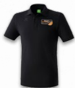
ERIMA Poloshirt 29,95 €