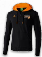
ERIMA Sweatjacke 44,95 €