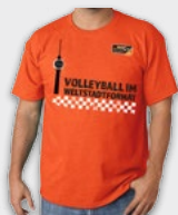
Weltstadtshirt 19,95 €