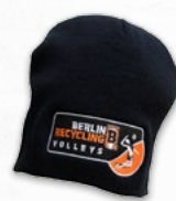
Wintermütze 12,95 €