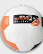
Knautschball 5,95 €