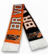
Fanschal 15 €