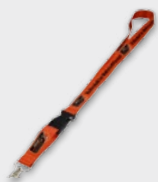
Lanyard 4,50 €