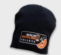
Wintermütze 12,95 €