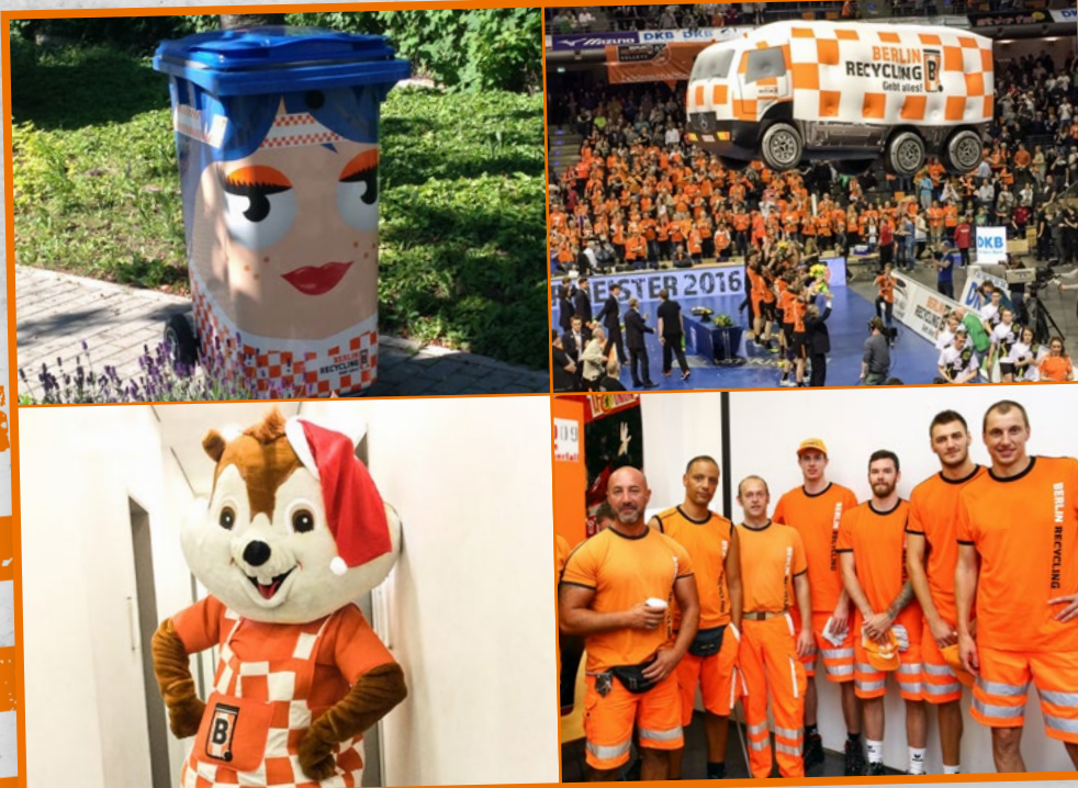
Bei einigen Heimspielen in der Max-Schmeling-Halle zu sehen: Tonnja, das Zeppelin-Müllauto, Hamster Hugo, das Maskottchen von Berlin Recycling, und einige Tonnenboys (hier mit Spielern)