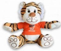
Charly 19,95 €