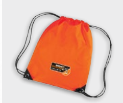
Sportbeutel 12,95 €