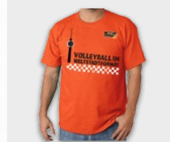
Weltstadtschirt 19,95 €