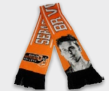
Kühner Schal 15,- €