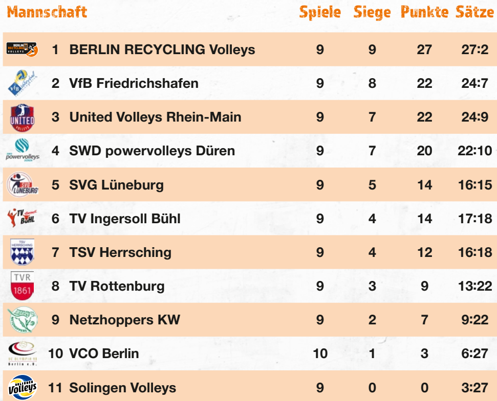
Tabelle 1. Volleyball Bundesliga