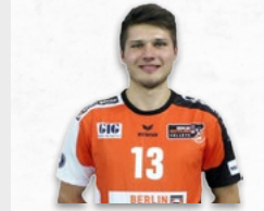
Heimtrikot 2016/2017 64,95 €