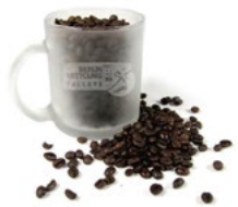
Glastasse 9,- €