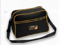
Retro Umhängetasche 24,95 €